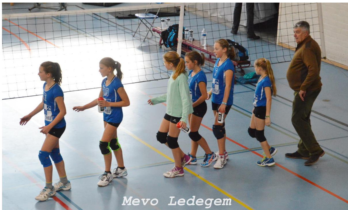
FOTO : U13 MEISJES PROVINCIAAL 2016-2017

Het seizoen 2001-2002 leverde een nieuwe promotie op via de eindronde, het werd weer een heen en terug. Maar het seizoen 2003-2004 werd de titel gespeeld in 3de provinciale. “Wij hadden toen een heel ambitieuze trainer die absoluut in 2de provinciale wou blijven. Er werd uitgekeken naar versterking van buitenuit en een vijftal speelsters kwam de ploeg vervoegen. Om ook de eigen jeugdspelsters speelgelegenheid te geven werd gestart met een tweede ploeg met eigen speelsters in 3de provinciale, toen nog de laagste reeks. De ploeg kon zich handhaven in tweede en promoveerde uiteindelijk naar de hoogste provinciale reeks. Een avontuur dat maar één seizoen duurde. Ondertussen bleven wij altijd voldoende aandacht schenken aan de jeugd.”