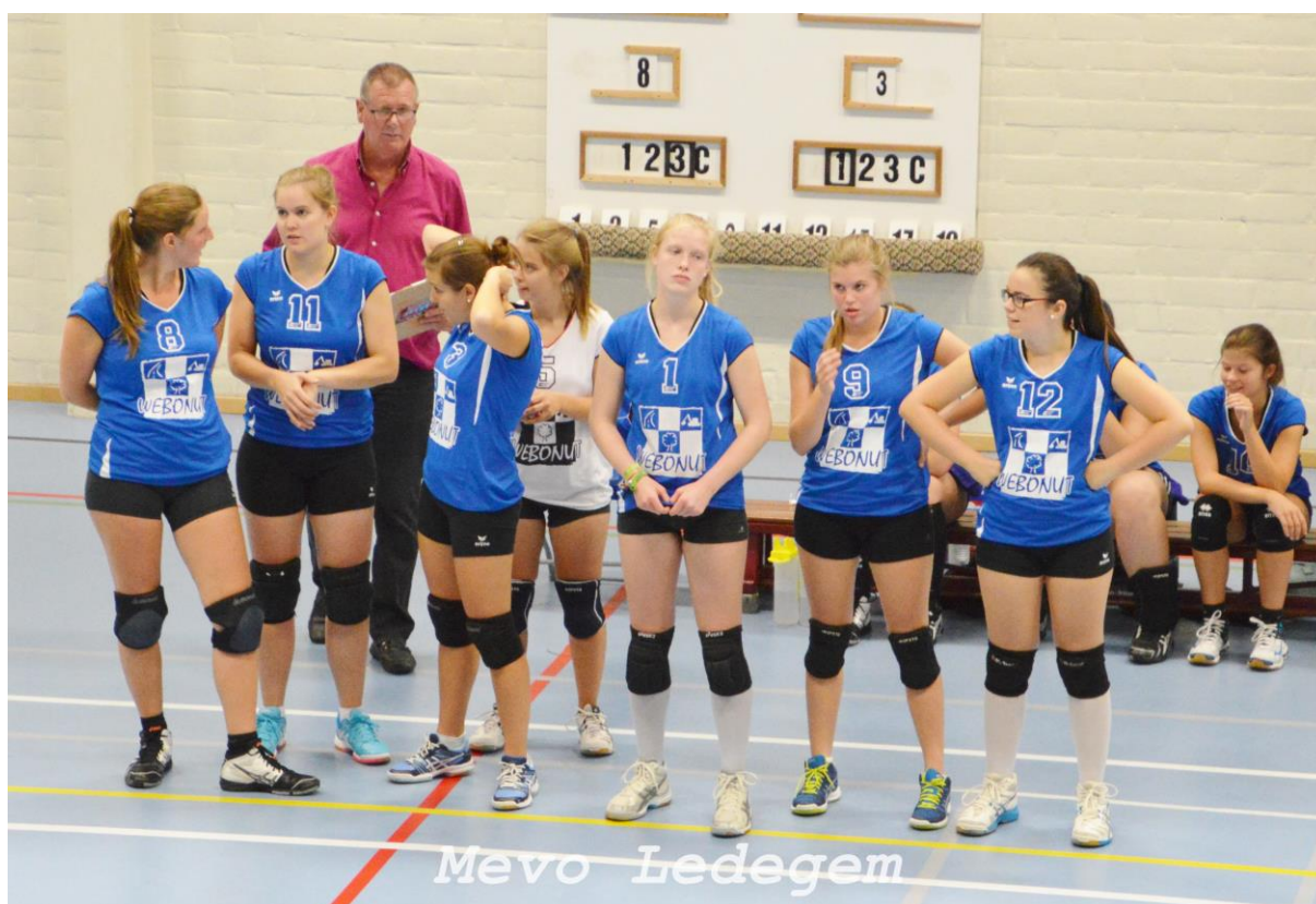
FOTO : 4° PROVINCIALE DAMES 2016-2017

Mevo Ledegem, wat staat voor MEisjesvolleybal LEdegem, speelt dit seizoen in 4de provinciale dames B. Naast de senioresploeg wordt er dit seizoen met drie jeugd ploegen aangetreden. Die jeugdwerking krijgt de volle aandacht en de jongste jaren niet zonder succes. Het is de ambitie van het bestuur om vooral met eigen opgeleide speelsters aan te treden. Sportief is de ambitie dit seizoen mee te doen voor promotie naar 3de provinciale. Al is dat ook geen dwingende noodzaak.