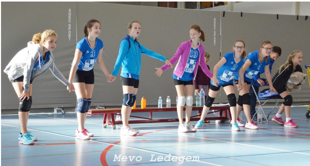
FOTO : U13 MEISJES REGIONAAL 2016-2017