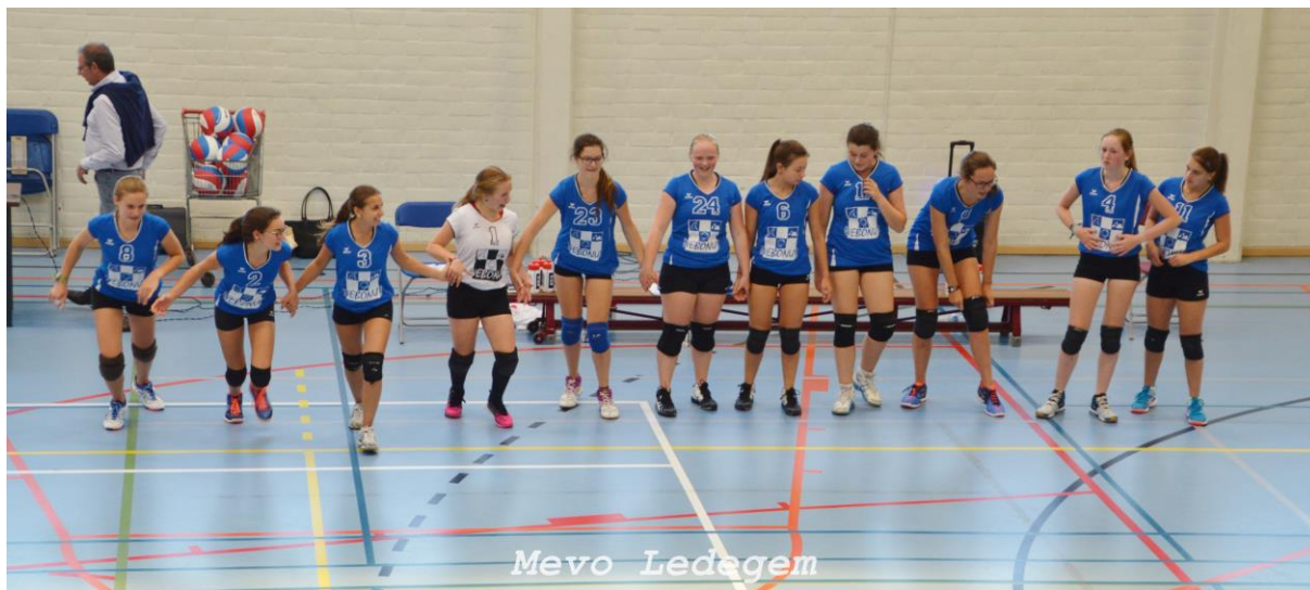
FOTO : U17 MEISJES PROVINCIAAL 2016-2017

Op sportief vlak ging het steeds beter in zoverre Mevo in het seizoen 1996-1997 een eerste keer promoveerde. Niet via een titel maar als bijkomende stijger. Het werd evenwel een retourticket.