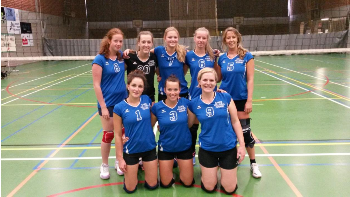
FOTO : 4° PROVINCIALE DAMES 2015-2016