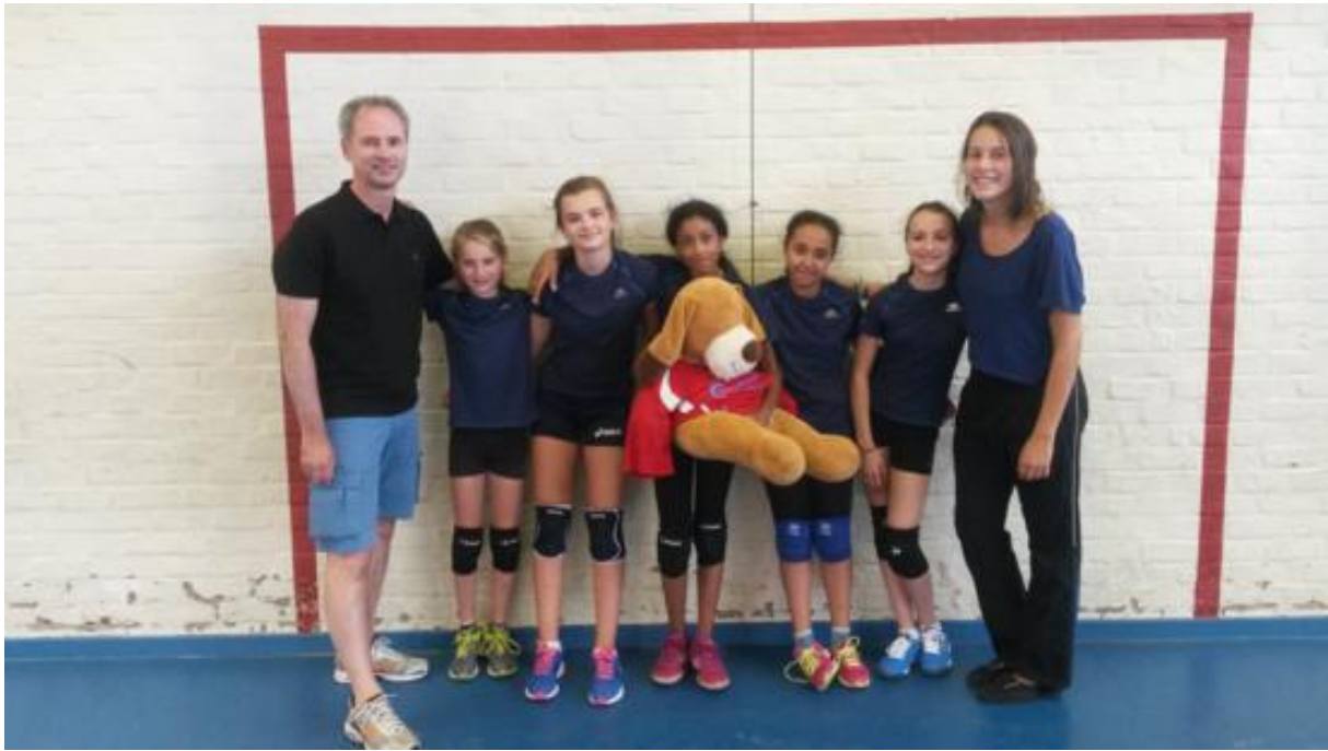
FOTO : U13 MEISJES 2015-2016