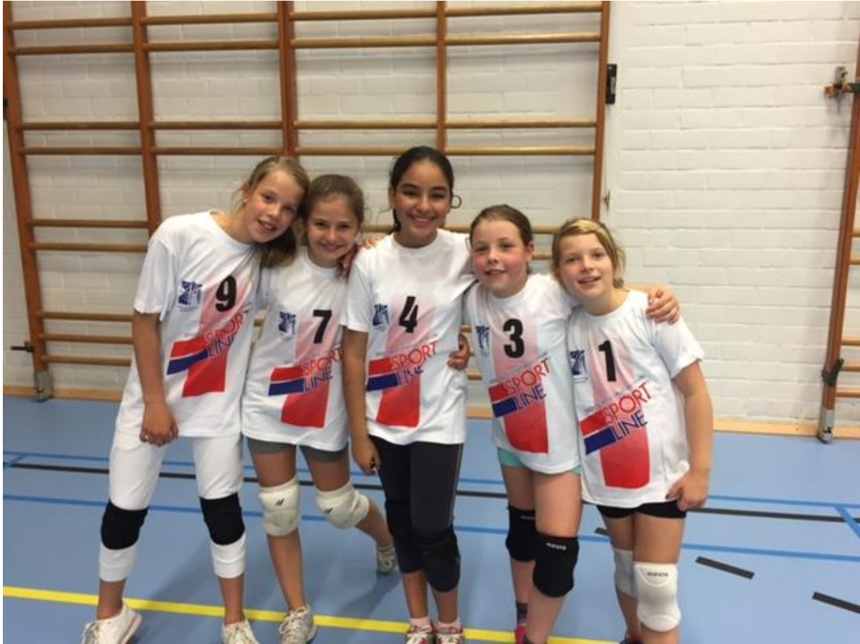
FOTO : U11 MEISJES 2015-2016