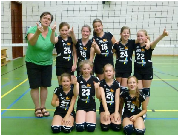
U 13 regionaal