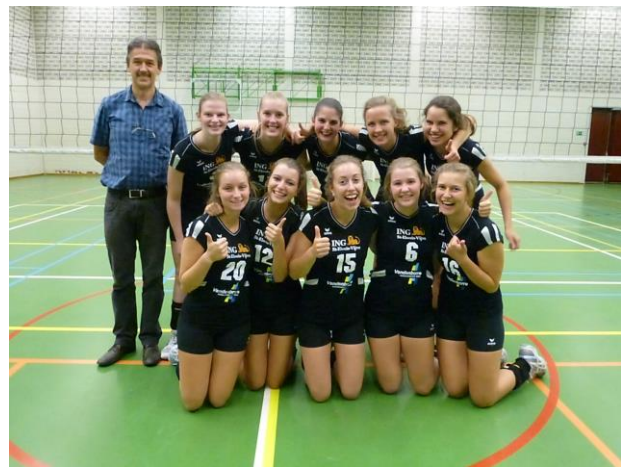
3 e provinciale

We hebben ook drie eigen jeugd ploegen, U15 regionaal, U13 provinciaal en regionaal.