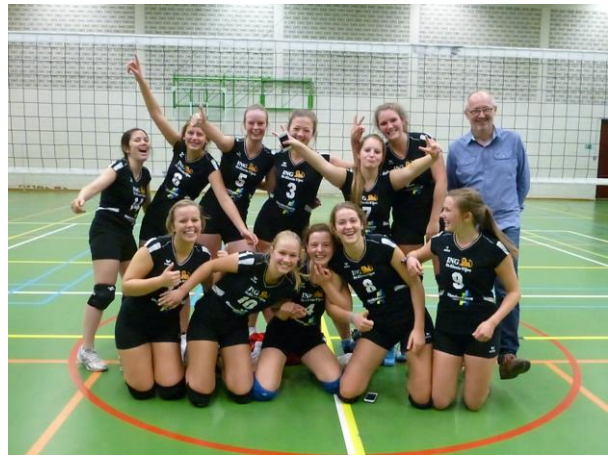
U 17 regionaal, samenwerking

“Wij willen met zoveel mogelijk eigen opgeleide speelsters zo hoog mogelijk competitie spelen. Vanaf de leeftijd van 6-7 jaar kunnen meisjes bij ons terecht. We hebben drie groepen opleiding: volleybalschool, initiatie beginners en initiatie gevorderden. Voor deze groepen worden in de loop van het seizoen, samen met een paar clubs uit de regio, enkele toernooien georganiseerd met spelvormen 2 tegen 2 en 3 tegen 3. Daardoor nemen we ook niet deel aan het VIS-project.