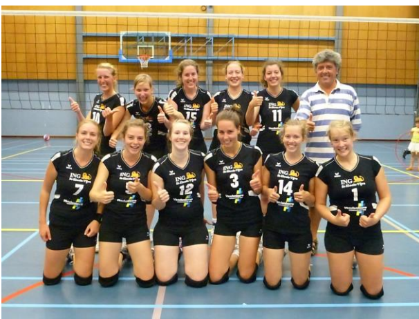
2 e provinciale

“Wat het ledenaantal en het aantal ploegen betreft mogen we niet klagen : 136 leden, twee damesploegen in competitie, 2 e - en 3 e provinciale.