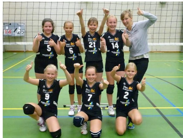
U 13 provinciaal

Voor het eerst in onze clubgeschiedenis hebben we voor dit seizoen een samenwerking met een andere club uit de regio. Onze 5 scholieren, U17, spelen dit seizoen als uitgeleende jeugdspelsters voor één seizoen bij de U17 regionaal van GIKS Mode Waregem. Een samenwerking die heel goed verloopt.”