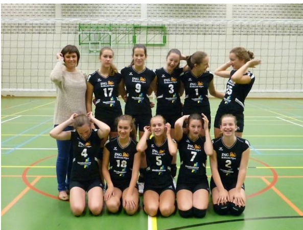
U 15 regionaal

We hebben ook drie eigen jeugd ploegen, U15 regionaal, U13 provinciaal en regionaal.