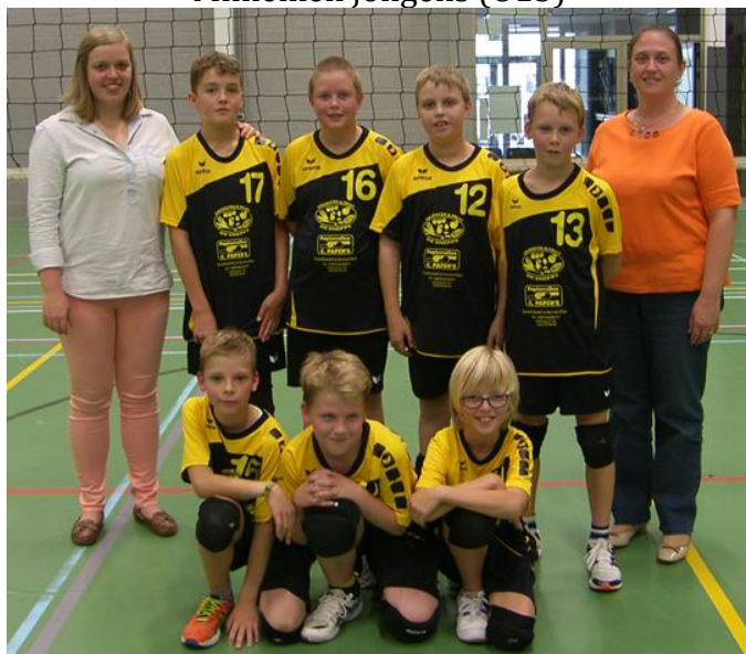
Miniemen jongens (U13)