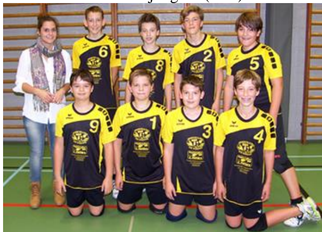
Kadetten jongens (U15)