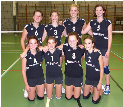
Scholieren meisjes (U17)