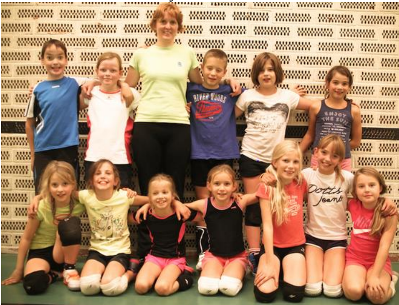
Volleytoer 2.0 Aarsele