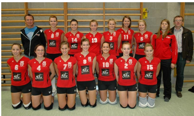
De huidige 2 de provinciale ploeg

Verder richtte men dit seizoen een nieuwe 4 de provinciale ploeg op met jeugd die vanuit de scholieren en de kadetten kwam. Beide ploegen staan mooi halverwege de rangschikking.”