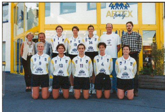
De ploeg die de doorbraak naar 2 de divisie forceerde

In het seizoen 95 is de doorbraak naar 2 de divisie, zij het via een eindronde, eindelijk een feit.