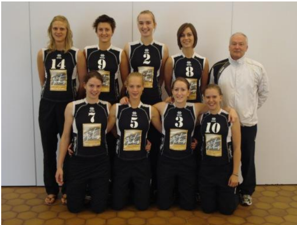
De ploeg in ereklasse.

Het seizoen 2006-2007 gaf een knalprestatie. De match op De Haan die moest gewonnen worden voor de promotie naar ereklasse werd wel verloren, maar De Haan gaf er de voorkeur aan om in 1 ste nationale te blijven en Waregem promoveerde zo naar de topreeks in het nationale vrouwenvolleybal, een vergiftigd geschenk, zou later blijken.