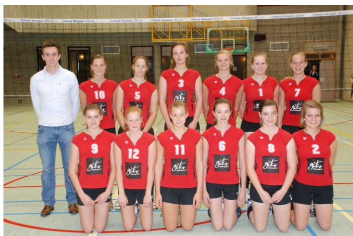
De huidige 4 de provinciale ploeg