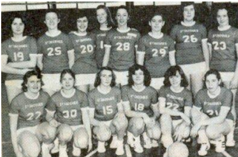
De beginjaren 70-75

Begin jaren '70 telt de vereniging reeds 51 leden, vooral in de tweede helft van de 70-er jaren, neemt de populatie, vooral bij de dames, toe en kan men een tweede damesploeg oprichten.