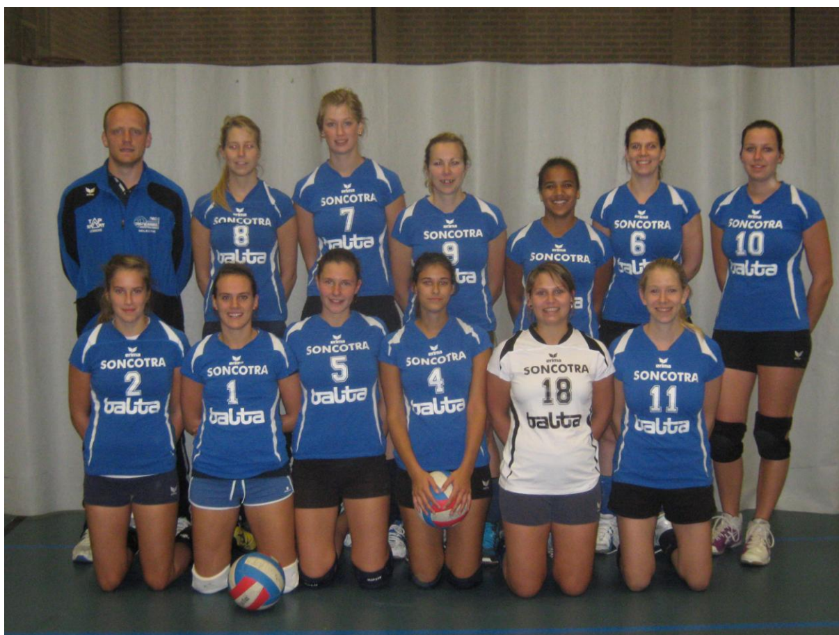
Dames 1 e provinciale